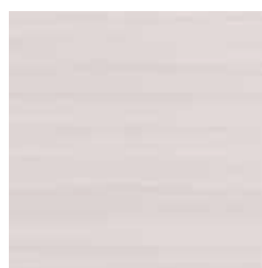
Larice sbiancato orizzontale Whitening Larch Horizontal