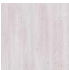
Rovere sbiancato Whitening Oak