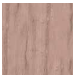
Rovere antico Antique Oak