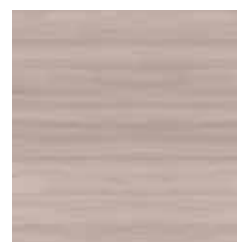
Olmo chiaro orizzontale Light Elm Horizontal