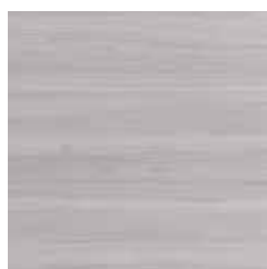
Rovere grigio orizzontale Grey Oak Horizontal